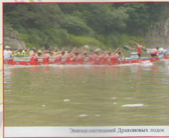
Экзотический Драконовых лодок

ют "здоровьем": в это время особенно распространены разного рода заразные заболевания. В связи с тем бытуют обычаи, помогающие отвести злые чары от семьи, сохранить здоровье близких. К входным дверям привязывают ветки баньянового дерева, листья пальмы какамусы, побеги фикуса или пучки речного камыша. На ворота или двери прикрепляют изображение страшного божества по имени Чжун Гуй, который не позволяет нечисти проникнуть в дом. С профилактической целью, но не без