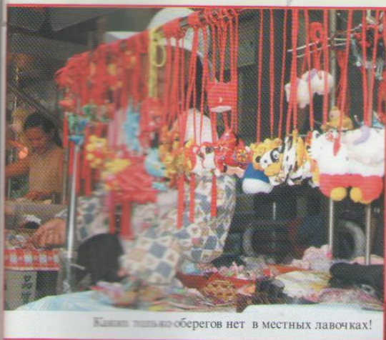
Каких только оберегов нет в местных лавочках!

Ну и, наконец, то, без чего не обходится праздник Дуань'у - цзунцзы. Снова ароматы и вкусы местной кухни, наполняющие улочки и переулки Тайваня, опустошают кошельки и существенно увеличивают талии. Мы уже упоминали